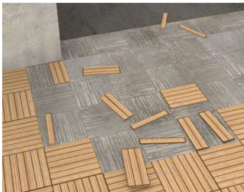
Décollement généralisé d'un parquet mosaïque collé sur béton.

Les revêtements de sol ont une fonction décorative et sont très sollicités par les déplacements des personnes et des objets. Il en existe une très grande variété intégrant des produits minéraux (carrelages, pierres), organiques (bois), synthétiques (peinture, revêtements plastiques ou textiles). Leur mode d'application ou de fixation au plancher dépend de leur nature : scellement, collage, clouage sur une ossature, application directe en couche mince d'une peinture.