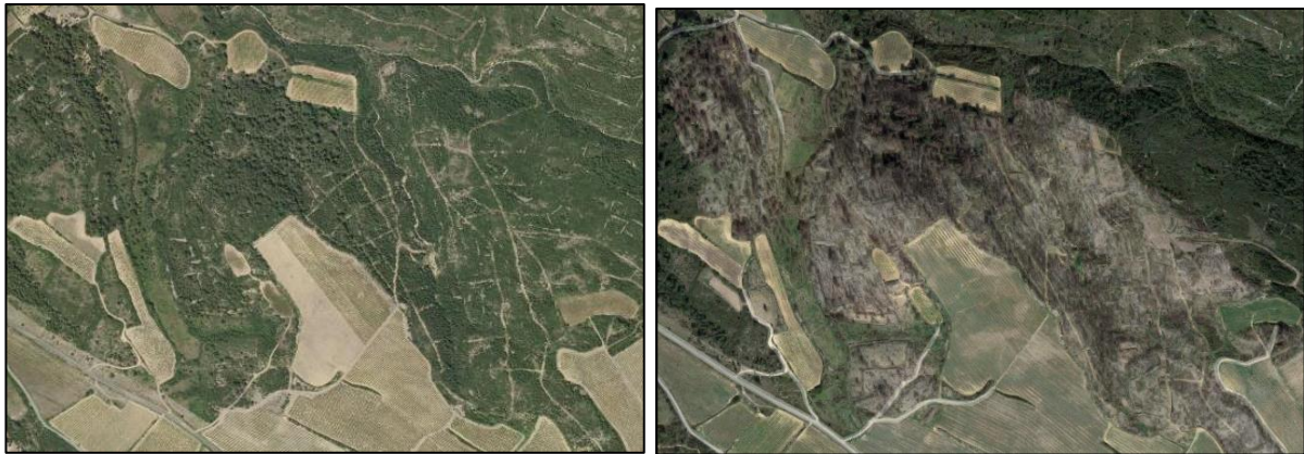
FIGURE 2. — Photographies aériennes d'une peuplement avant incendie (à gauche) et après incendie (à droite).