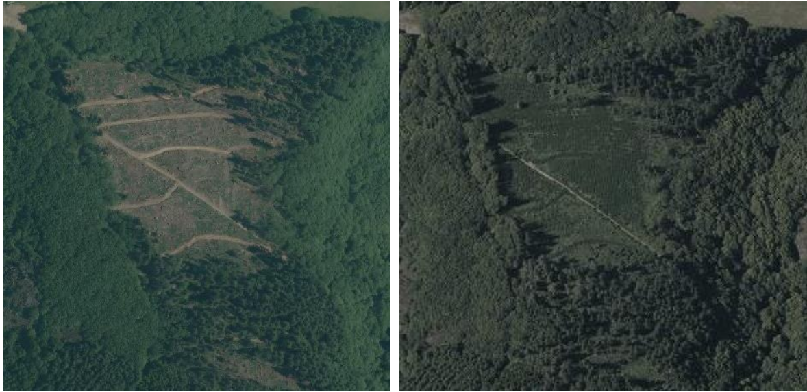
FIGURE 1. — Photographies aériennes d'un peuplement de douglas avant tempête en 2006 (photo en haut à gauche), après passage de la tempête Klaus de 2009 (en haut à droite : on devine les arbres jonchant le sol), après vidange des chablis en 2010 (en bas à gauche : on voit les tires de débardage) et quelques années après reboisement en 2013 (en bas à droite). Extraits d'orthophotos issus de https://remonterletemps.ign.fr (Source : IGN)