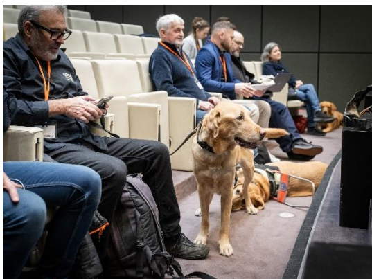
Figure 1 : Personnes accompagnées de leurs chiens guides et/ou d'assistance lors du colloque

Les questions posées dans le chat seront traitées prochainement et leurs réponses seront mises à disposition dans un document publié sur le site internet du ministère .