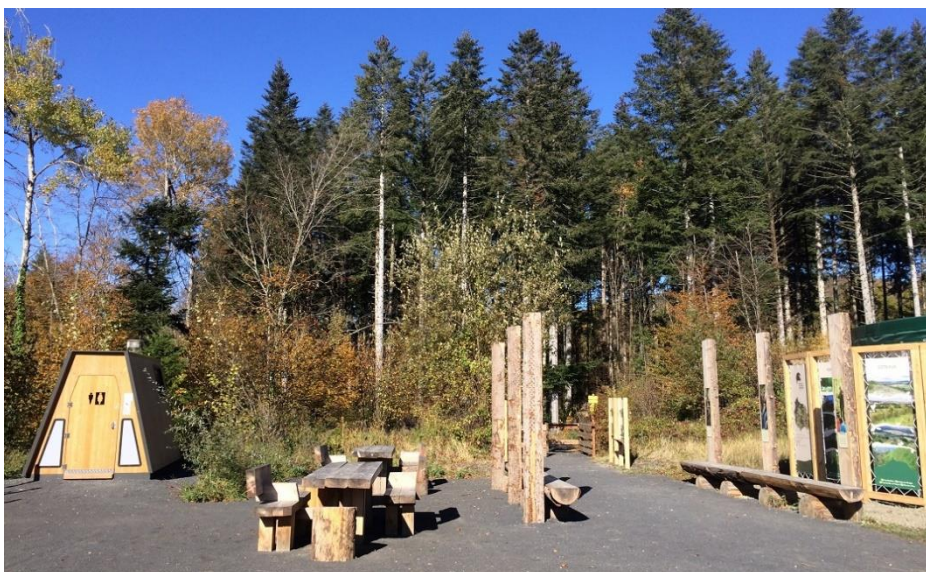
Entrée de la forêt avec de nombreux équipements : toilettes accessibles, bancs, tables de pique-nique, panneaux

Tous les aménagements ont été pensés et conçus dans l'objectif de sécuriser le public accueilli.