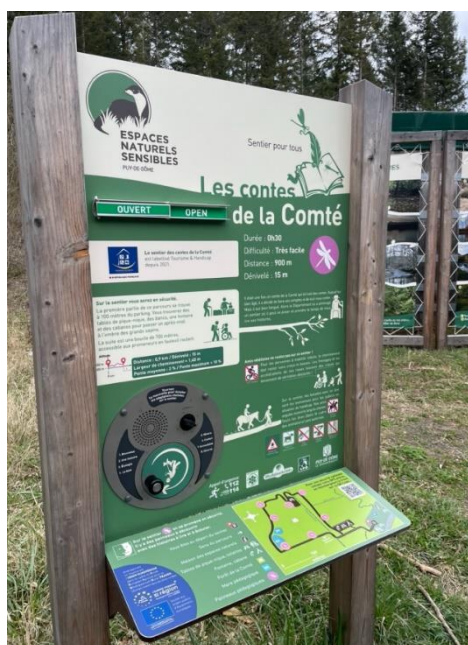
Panneau thématique et pédagogique accessible, avec une manivelle, un plan en relief, et des contrastes de couleurs – ©CD63