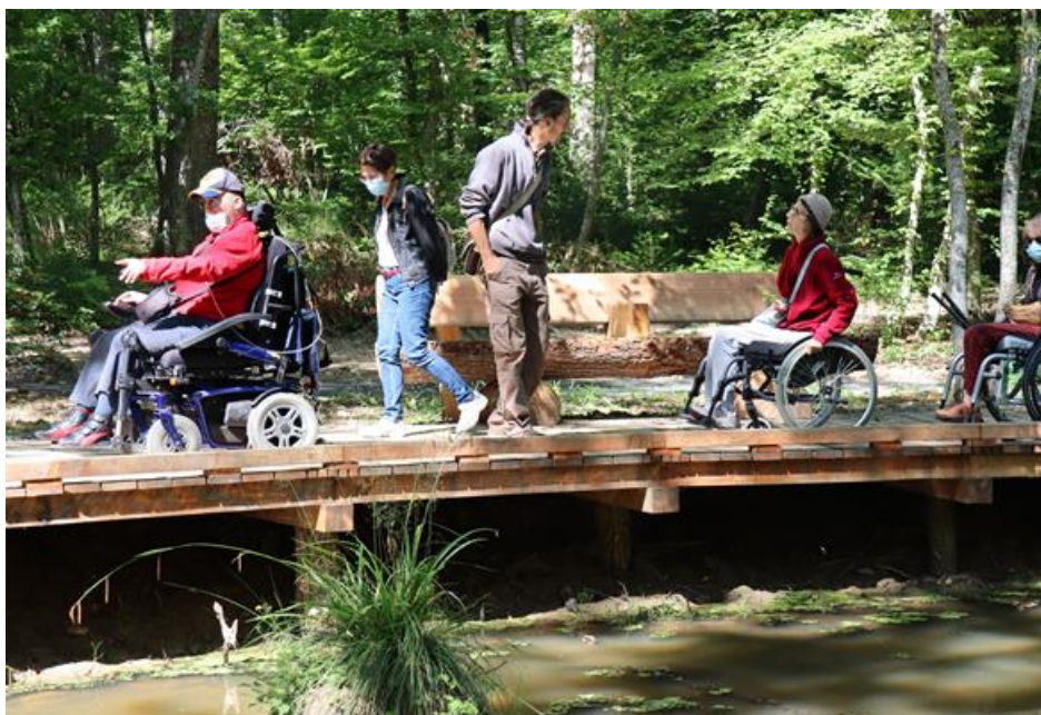
Groupe de personnes en situation de handicap lors d'une sortie

Des enfants de crèches environnantes viennent également en sortie sur la forêt depuis l'ouverture de ce sentier.