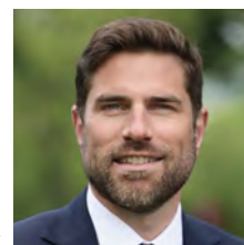
Vincent Jeanbrun Ministre de la Ville et du Logement

Avec ce projet de loi, notre responsabilité est donc immense : reconstruire des logements, bien sûr, mais surtout protéger, réparer, reconstruire des trajectoires de vie et surtout une espérance française.