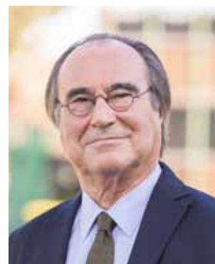
François COMMEINHES, maire de Sète

La prise de conscience est aujourd'hui partagée : tout projet d'urbanisme sur le littoral doit prendre en compte les phénomènes hydro-sédimentaires entraînant son érosion, sous peine de disparaître en quelques années. De même, l'aménagement durable du littoral suppose de préserver et d'adapter des secteurs-clés comme l'agriculture, la conchyliculture et l'hôtellerie de plein air ».