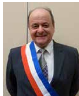
Bernard LEROY , président de la communauté d'agglomération Seine Eure (la CASE) et maire du Vaudreuil

Notre intercommunalité est fortement engagée en faveur de la transition écologique du territoire : qualité de l'environnement et développement plus sobre sont des axes structurants de l'action locale. L'attention portée à la transformation des friches et à la qualité de vie des habitants se concrétise dans ce projet de réhabilitation d'une station Esso en espace public végétalisé favorisant renaturation, biodiversité et lutte contre le réchauffement climatique. »