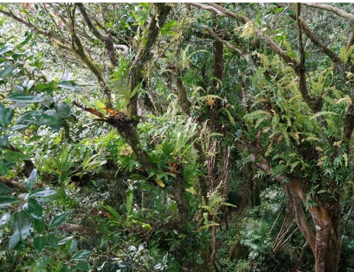
Espaces forestiers au sein de la réserve