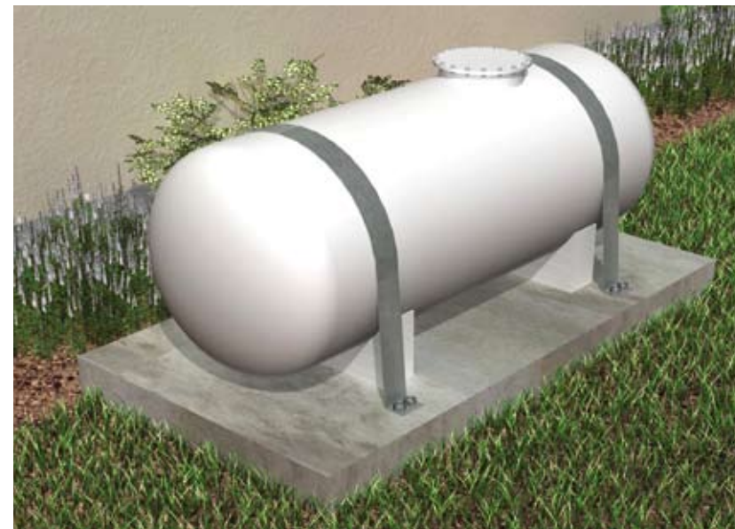
Renforcement du support et de l'ancrage de la cuve

► A défaut, le renforcement du support et de l'ancrage de la cuve ou du réservoir sur ce support, doit être entrepris.