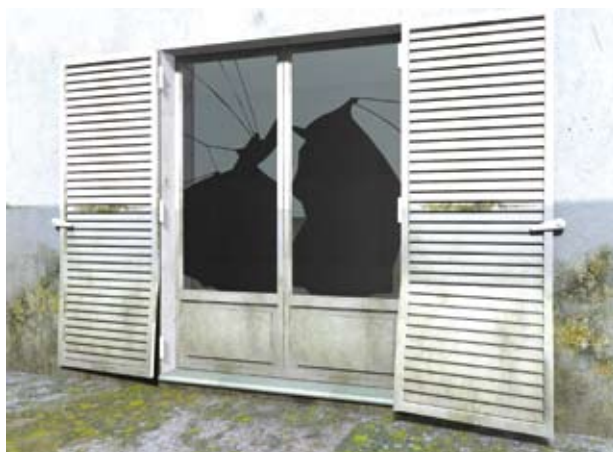
Dégradation d'une porte fenêtre.

Si certains cas de déformation ou de rupture par la force de l'eau ont été signalés sur les menuiseries extérieures et les volets, c'est avant tout l'immersion qui peut provoquer des dégâts. Le choix du matériau constitutif est donc essentiel. Par exemple, après un contact avec l'eau, les menuiseries bois subissent, lors du séchage, des déformations, des gonflements, des décollements, et des apparitions de moisissures. De fait, très souvent, elles n'assurent plus leur fonction et il est nécessaire de procéder à leur remplacement.