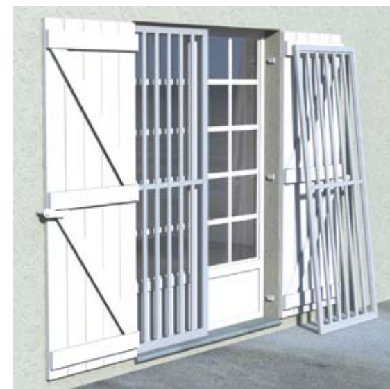
Mise en place de grilles de portes devant des portes-fenêtres.

Dans certaines zones où l'eau monte rapidement, il est recommandé de laisser entrer l'eau dans l'habitation afin d'équilibrer les pressions intérieure-extérieure et donc éviter des dommages sur la structure du bâtiment. Pour cela, une grille anti-intrusion, dont le système d'attache à la maçonnerie serait préalablement installé, pourra être mise en place temporairement devant les portes et les fenêtres laissées ouvertes. Cette mesure permet également un séchage plus efficace post-inondation (temps d'ouvertures plus important en limitant les risques d'intrusion et de vols).