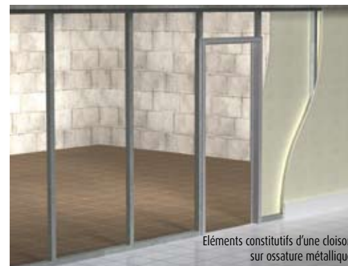
Éléments constitutifs d'une cloison sur ossature métallique

” Nota : le remplacement des plaques de plâtre par des plaques plus résistantes à l'eau (ciment-fibré, stratifié compact) limite leur dégradation mais ne prévient ni la pénétration d'eau polluée à l'intérieur de la cloison sur ossature, ni l'immersion de l'armature.