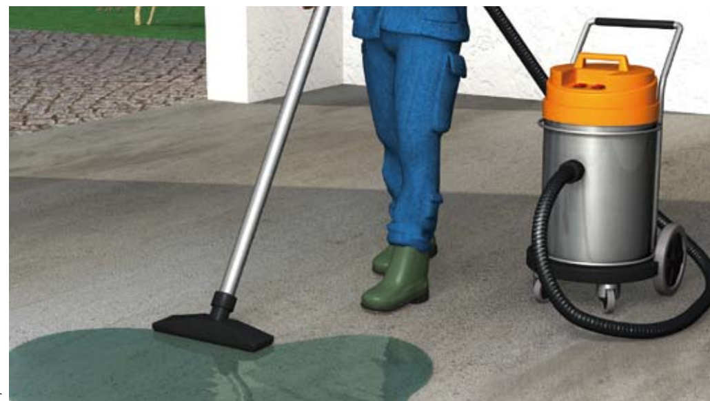
Elimination des eaux résiduelles au RDC.

La présence d'un point bas permet de recueillir l'eau vers un point d'aspiration (pompe manuelle, pompe électrique). Ce procédé requiert l'usage d'une source électrique, d'une ligne d'alimentation et d'un équipement de pompage présentant toutes les garanties de sécurité pour éviter les chocs électriques.