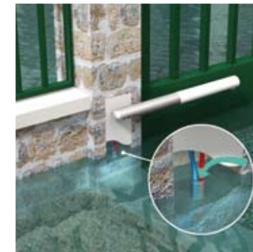
Passage possible de l'eau par les entrées de gaine.

La limitation de la pénétration de l'eau dans le logement par les défauts de construction passe par l'application simultanée, dans la hauteur des parties susceptibles d'être immergées, des mesures suivantes :