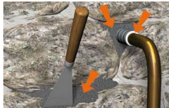
Situation après travaux : colmatage des voies d'eau.