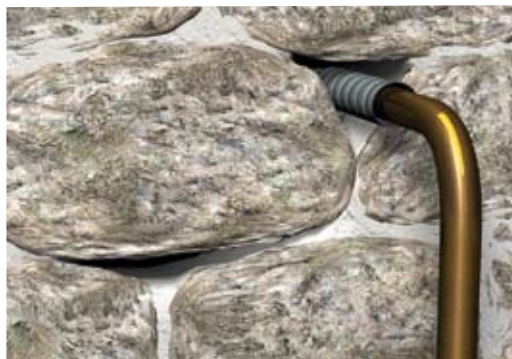
Situation initiale : passages possibles de l'eau à travers le mur.