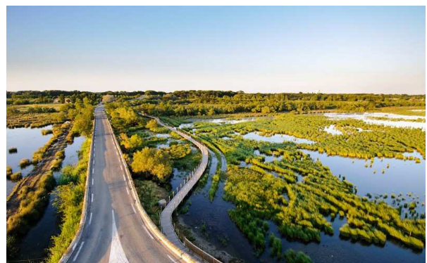
Figure 1 : Route départementale en Languedoc-Roussillon (marais de la Tour Carbonnière).

La définition de mesures ERC suppose de prendre en compte les grands principes qui régissent cette séquence, inscrite dans le droit français depuis la loi du 10 juillet 1976 relative à la protection de la nature, et qui a été renforcée concernant la biodiversité par la loi du 8 août 2016 pour la reconquête de la biodiversité, de la nature et des paysages.