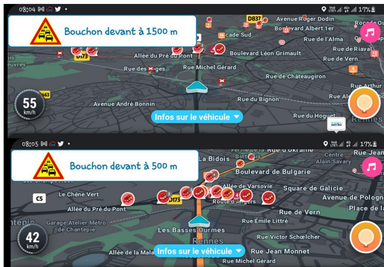
Affichage sur l'application CoopITS d'un message D11 émis depuis le TMS de la DIRO (Rocade de Rennes – janvier 2023)

Enfin, les collectivités bretonnes impliquées dans les C-ITS depuis le projet Scoop (Départements des Côtes d'Armor et d'Ille-et-Vilaine, Saint Briec Armor Agglomération, Région Bretagne) ont continué dans InDiD leur collaboration au site ouest, pour partager leurs réflexions sur les possibles apports des C-ITS aux nouvelles solutions de mobilité.