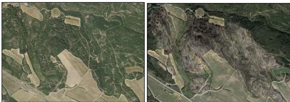
FIGURE 1. — Photographies aériennes d'une peuplement avant incendie (à gauche) et après incendie (à droite).

Le Porteur de projet devra calculer la surface à boiser, en ôtant les surfaces n'ayant pas été ravagées par l'incendie.