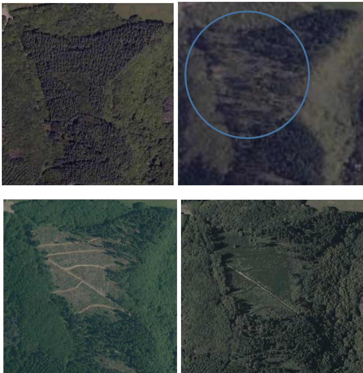
FIGURE 2. — Photographies aériennes d'un peuplement de douglas avant tempête en 2006 (photo en haut à gauche), après passage de la tempête Klaus de 2009 (en haut à droite : on devine les arbres jonchant le sol), après vidange des chablis en 2010 (en bas à gauche : on voit les tires de débardage) et quelques années après reboisement en 2013 (en bas à droite). Extraits d'orthophotos issus de https://remonterletemps.ign.fr (Source : IGN)

Klaus 3,4 . Ce seuil est maintenu pour cette Méthode. Pour ce faire, le Porteur de projet devra faire une estimation de l'ampleur des dégâts survenus dans sa parcelle afin de savoir s'il est éligible ou pas. Les photographies aériennes peuvent suffire pour cette estimation.