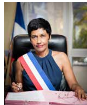
Éricka BAREIGTS, maire de Saint-Denis

Avec le réchauffement climatique, nous devons changer notre manière de penser la ville. Le remplacement de l'ancienne bibliothèque départementale par une micro-forêt est un pas de plus dans le projet de « ville jardin » que nous élaborons. C'est un élément incontournable dans le renouveau du Barachois pour une ville plus apaisée, plus accessible aux piétons et plus agréable à vivre. En sollicitant le Fonds vert sur des espaces denses de la ville, Saint-Denis veut reconnecter ses concitoyens à la faune et la flore endémiques de l'île ».