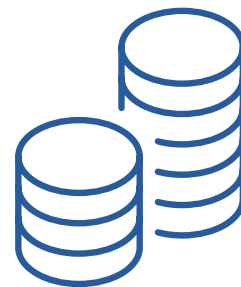
Répartition des dossiers par mesure