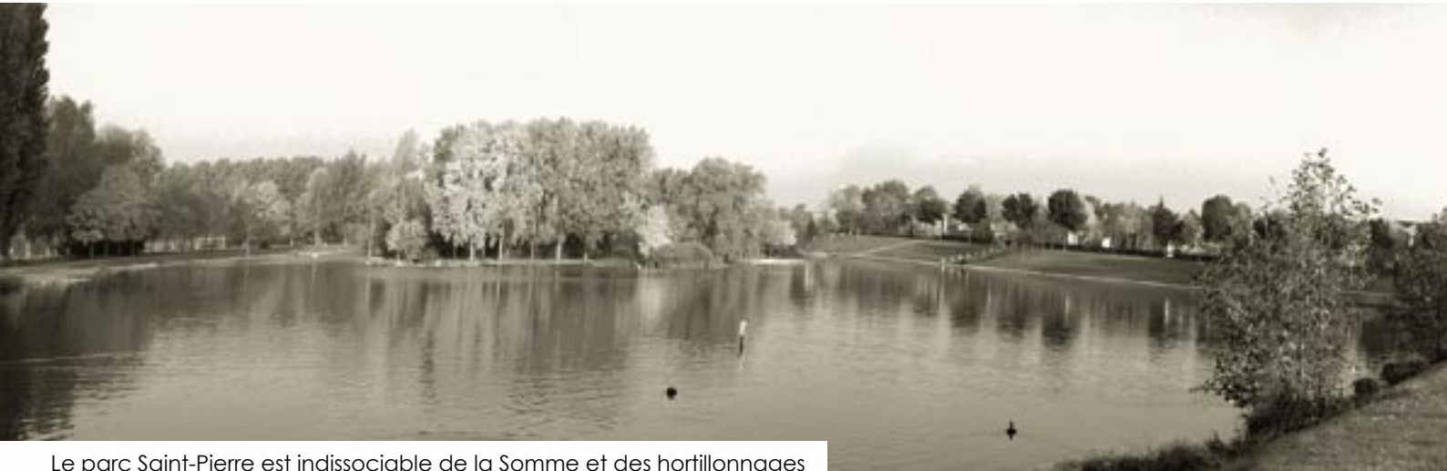
Le parc Saint-Pierre est indissociable de la Somme et des hortillonnages The Parc Saint-Pierre is inseparable from the Somme and the hortillonnages