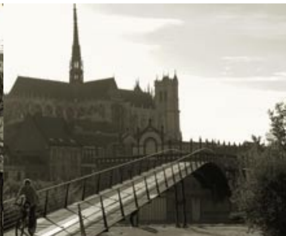
Un principe d'articulation entre les différents espaces de la ville It acts as a hub, connecting the various parts of the town