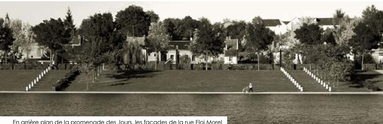
En arrière plan de la promenade des Jours, les façades de la rue Eloi Morel In the background to the Promenade des Jours, the facades of Rue Eloi Morel