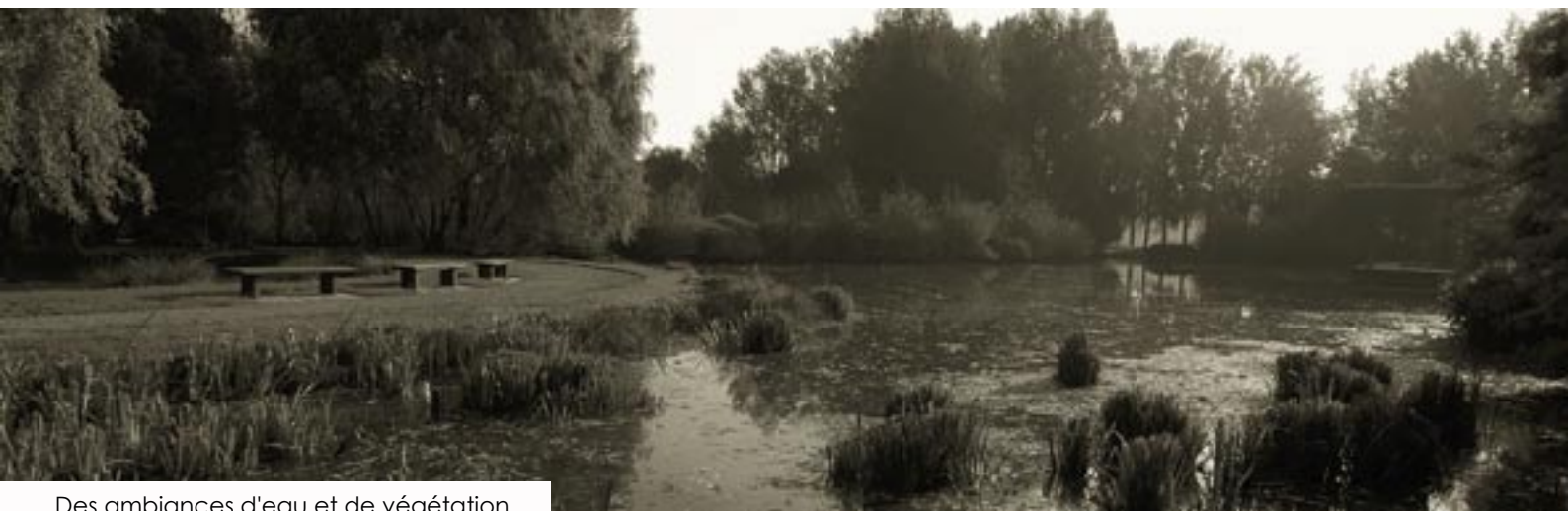
Des ambiances d'eau et de végétation... Water and plant environments ...