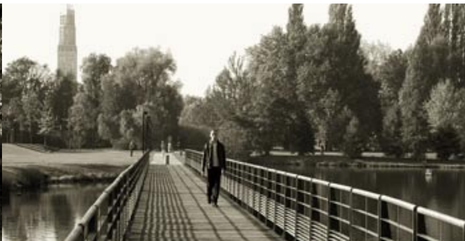
La Tour Perret dans la perspective de la passerelle de l'étang Saint-Pierre The Tour Perret seen from the footbridge on the Saint-Pierre lake