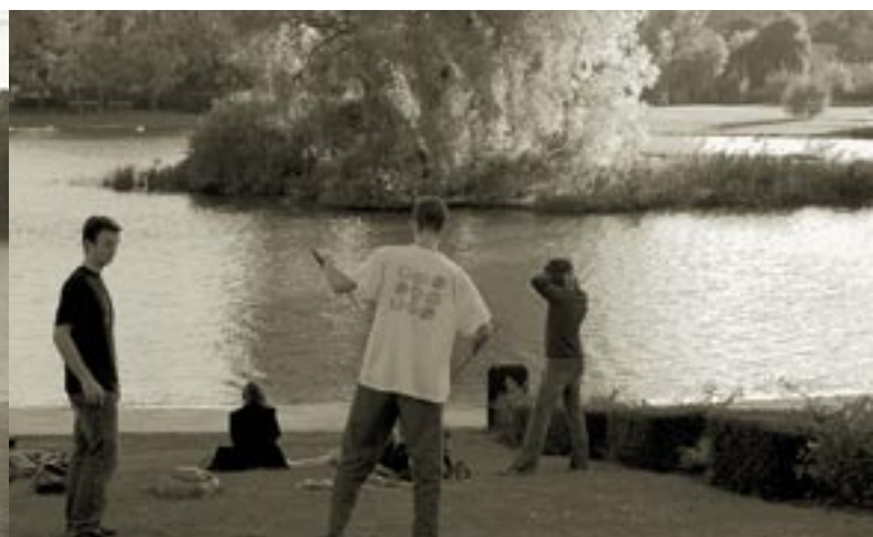
... pour la contemplation et l'intimité for contemplation and privacy.