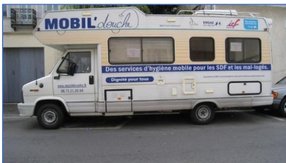
Mobil'douche de l'association Depaul

Les véhicules, achetés d'occasion grâce à des dons privés et réaménagés par Depaul, abritent un espace intimité avec une douche et un miroir, ainsi qu'une partie salon où il est possible de discuter avec les équipes de maraude (une salariée en contrat aidé de 28h par semaine accompagnée d'un.e bénévole) et prendre une collation. L'association met en outre à disposition des usagers des produits d'hygiène, des vêtements et sous-vêtements propres ainsi que des serviettes hygiéniques, issus de collectes réalisées par des entreprises ou des écoles.