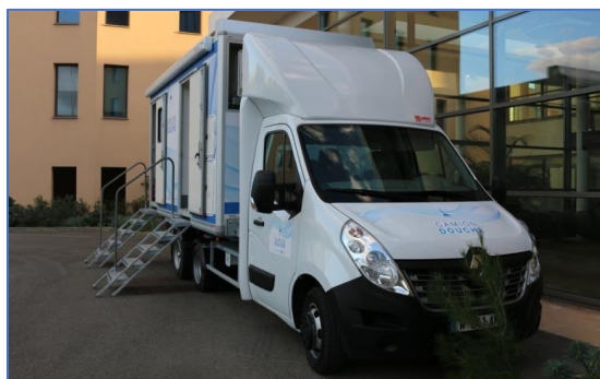
Camion O'lien en fonction à Marseille

Développé en 2017 par une équipe d'ingénieurs en nucléaire, le camion-douche O'lien est né de la volonté de permettre aux personnes sans abri de se laver et se changer dans des conditions d'hygiène et de sécurité correctes, dans un contexte de fermeture des bains-douches municipaux. Le dispositif est utilisé depuis 2018 par la Ville de Marseille, et plus récemment par la commune de Clermont-Ferrand.