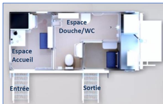
Agencement intérieur du dispositif O'lien

Constitué d'un tracteur et d'une remorque d'une longueur de 8 m, le camion O'lien abrite un sas d'accueil avec lavabo, un espace douche / WC équipé d'une trappe pour le linge sale et un vestiaire de sortie. Les différents équipements comportent peu de points de contact et sont désinfectés automatiquement après chaque passage. Doté d'un réservoir d'eau embarqué de 400 litres et d'une cuve de collecte des eaux usées de même contenance, le dispositif peut assurer entre 10 et 12 douches en autonomie. Une modification facilitant son raccordement est actuellement en cours de développement afin de permettre au véhicule de rester à poste plus longtemps.