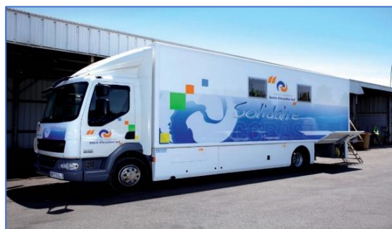
Véhicule d'accueil de jour itinérant de la COBAS

laquelle se sont récemment ajoutés 35.000€ pour la rénovation de l'espace hygiène et la réparation du système de climatisation. Les frais de fonctionnement, incluant le contrat de prestation avec l'association laïque du Prado 33, le salaire de l'agent de la collectivité, la prestation nettoyage et la prise en charge des consommations d'eau et d'essence, se chiffrent à environ 160.000€ par an.